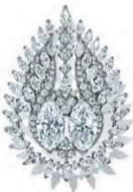
Jean Schlumberger pour Tiffany & Co Broche L'Envol, transformable en boudes d'oreilles, en platine, sertie de diamants. Prix sur demande.