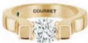
Courbet Bague Icône en or écologique sertie d'un diamant créé en laboratoire. Prix sur demande.