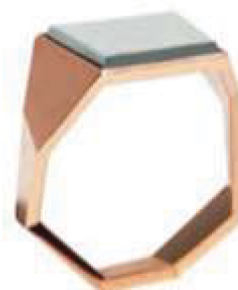
The Ray Bague Facets en or rose et miroir. 1 900 €.