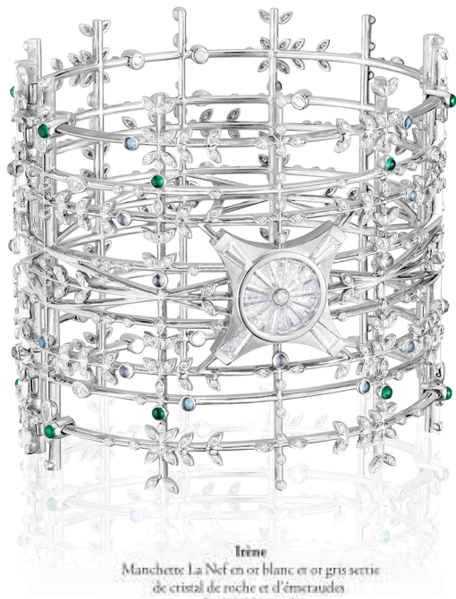
Irine Manchette La Nef en or blanc et or gris sertie de cristal de roche et d'émeraudes Prix sur demande.