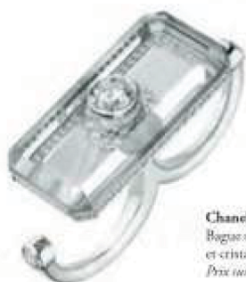
Chanel Joaillerie Bagues sur deux doigts N°5 en or blanc et cristal de roche sertie de diamants. Prix sur demande.