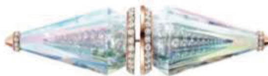
Boucheron Broche Faisceaux en or rose et cristal de roche, sertie de diamants. Prix sur demande.