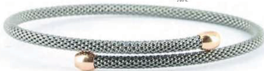
Lassaussois joaillier Junc en maille milanais en argent PVD gris anthracite et or rose. 140 €.